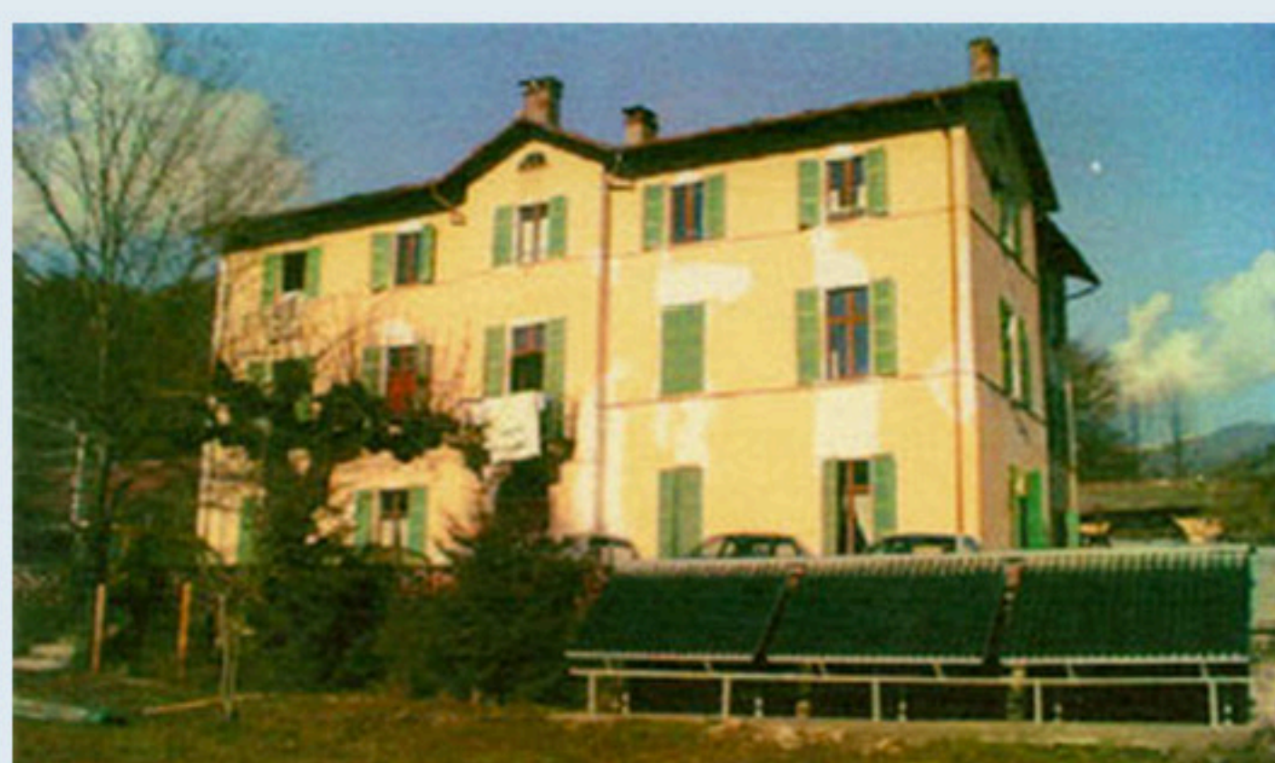
In primo piano il gruppo dei pannelli solari